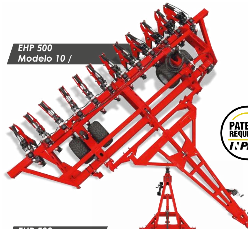
EHP 500 Modelo 10 /