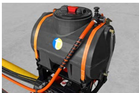
EXTENSOR DE BICA